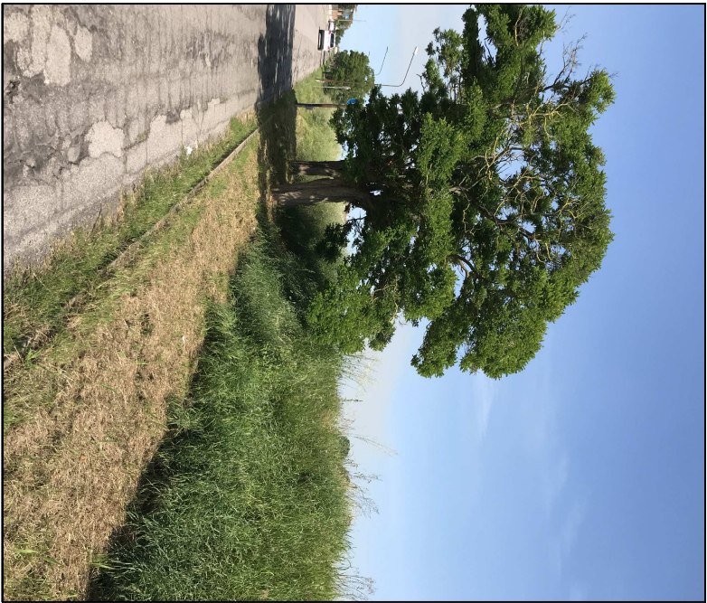
FOTO 1 Verde pubblico - argine