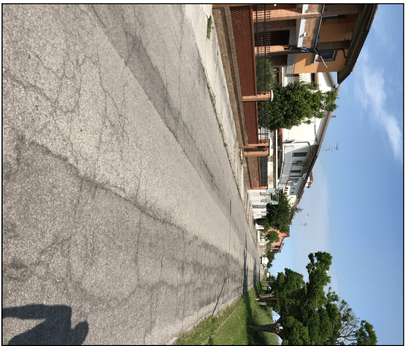
FOTO 1 Contesto