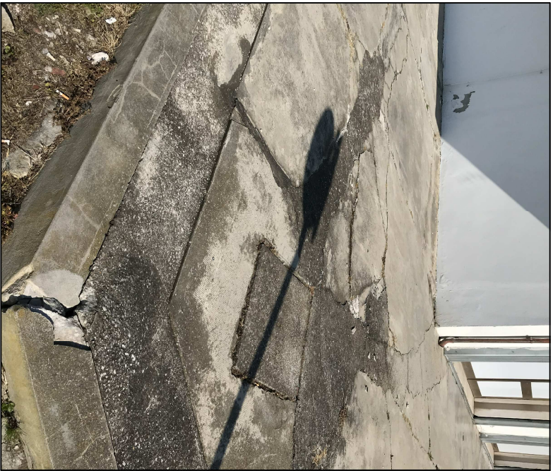
FOTO 3 Marciapiede angolo via Risorgimento