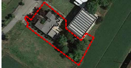
Fig. 7 Map. 592