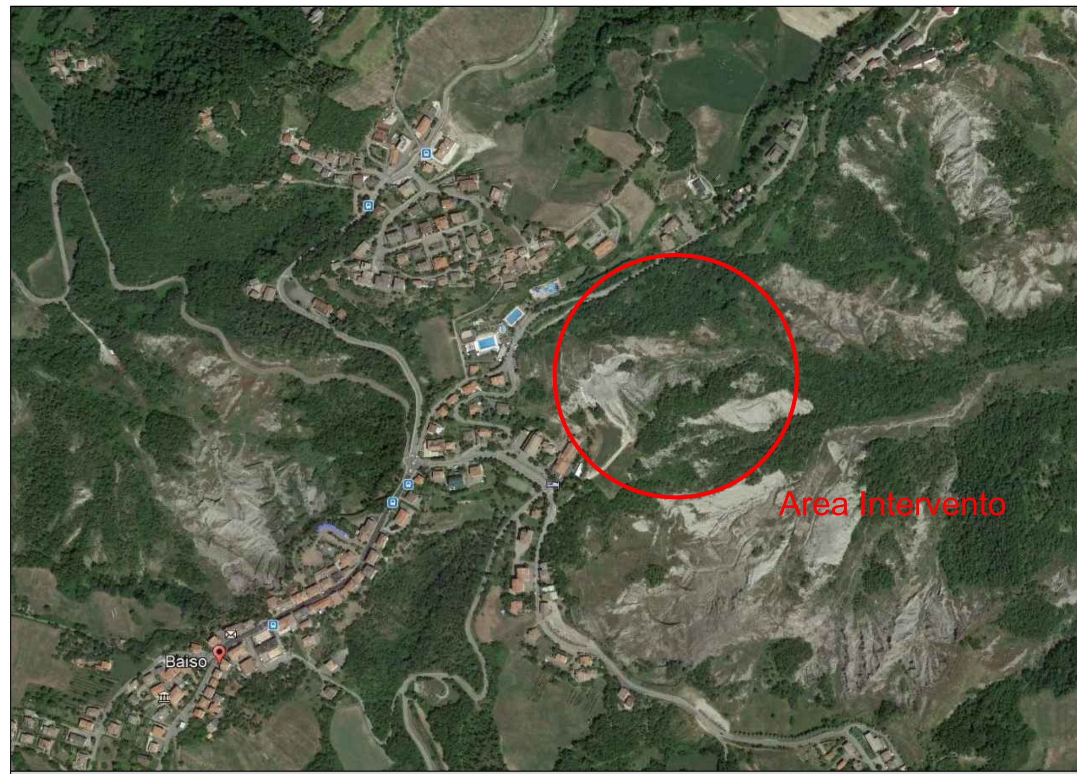
Corografia - Localizzazione area intervento su immagine satellitare