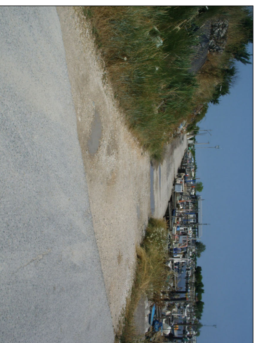
Banchina nord del punto di sbarco molluschi