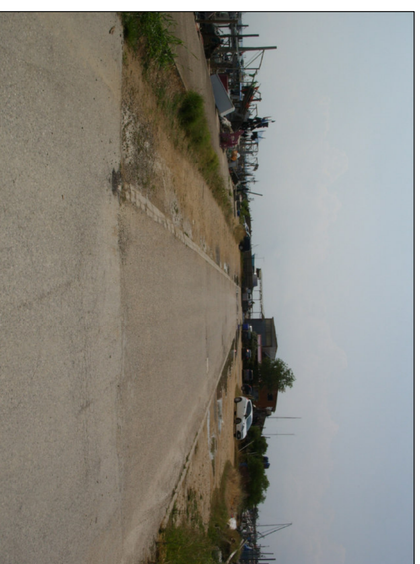
Area a sud del punto di sbarco molluschi