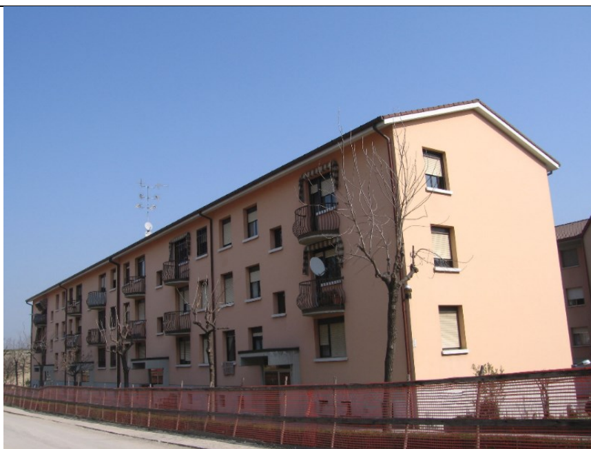
Prospetto fronte secondario