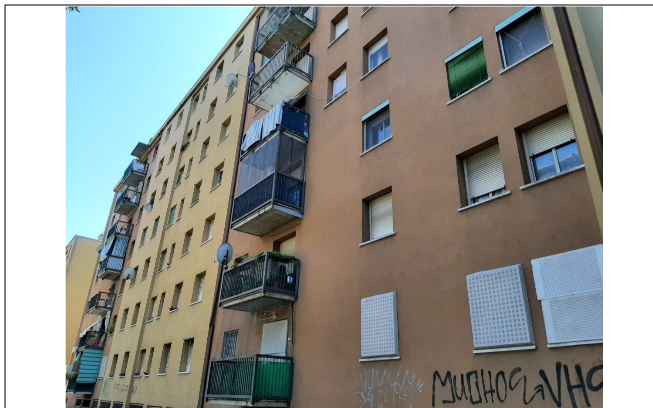
Prospetto fronte retro edificio