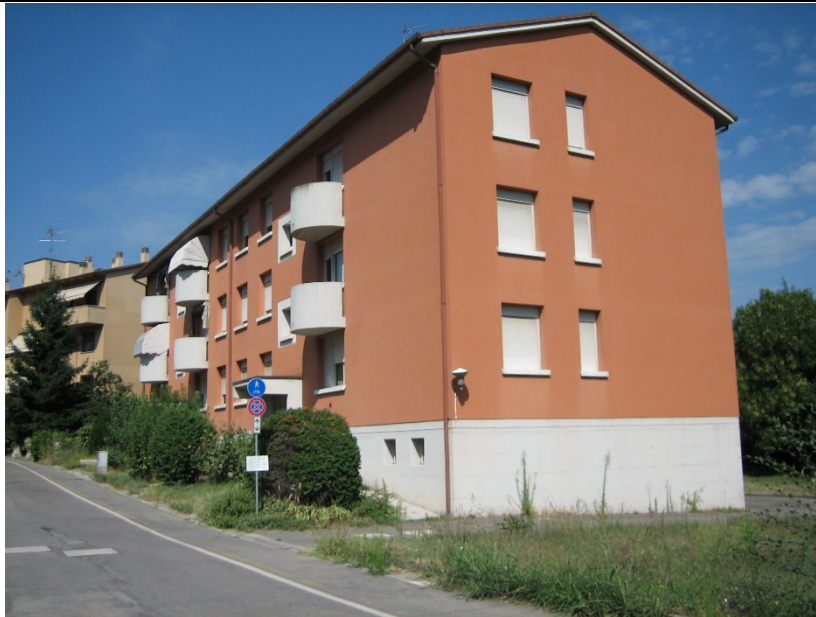
Prospetto fronte principale