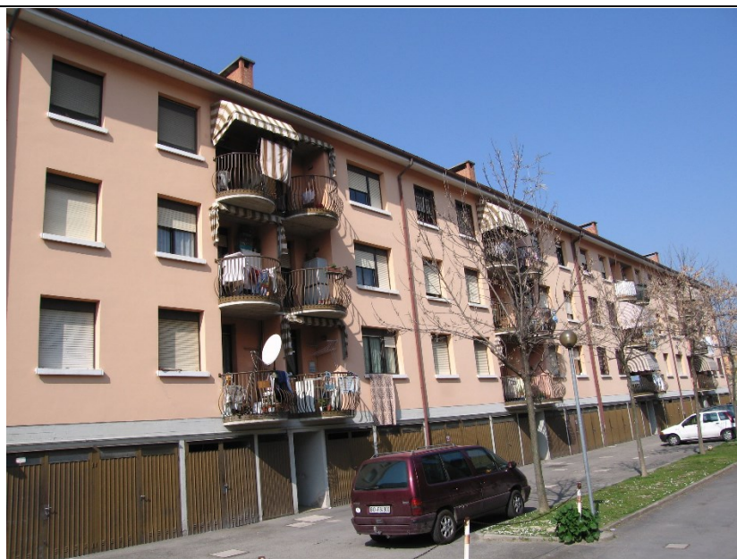
Prospetto fronte principale