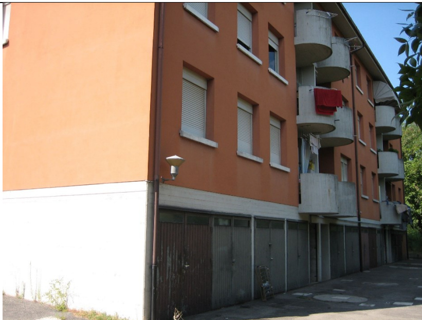
Prospetto fronte secondario