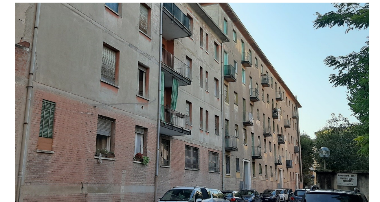
Prospecto fronte principale