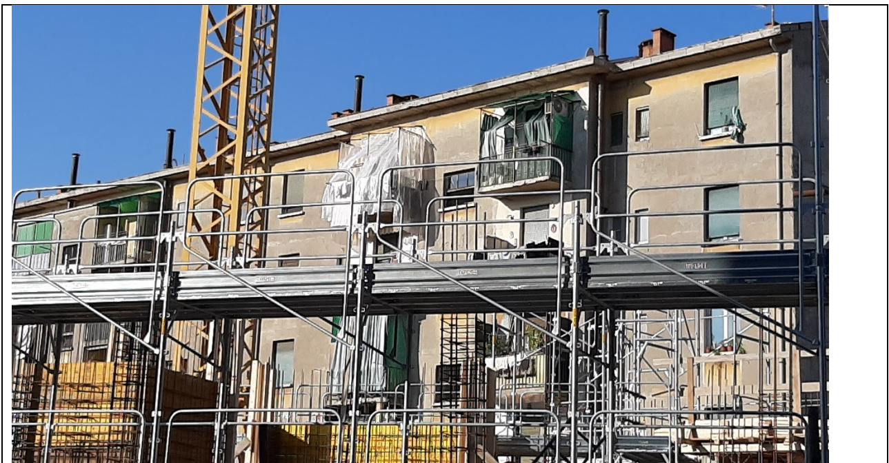
Prospetto interno corte