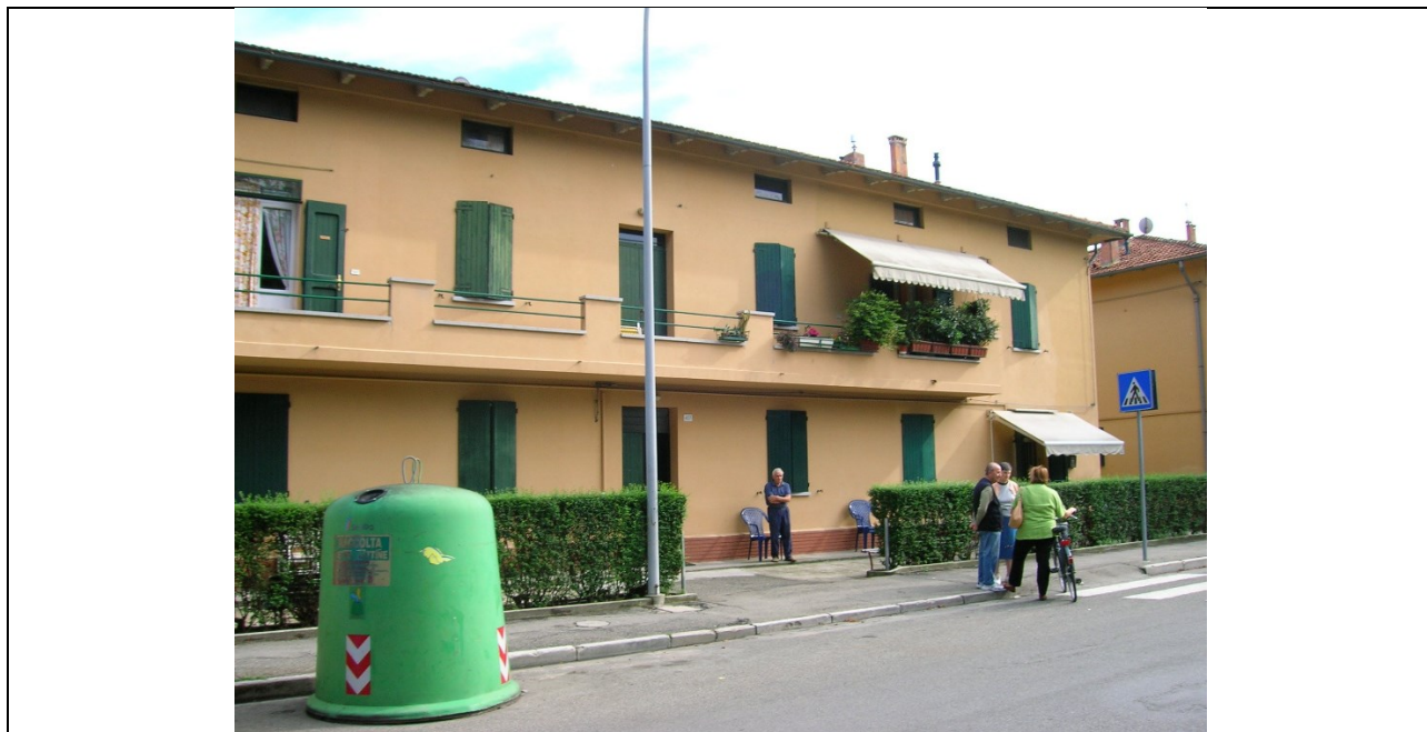
Prospetto fronte principale