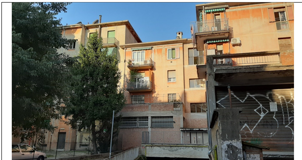
Prospecto fronte secondario