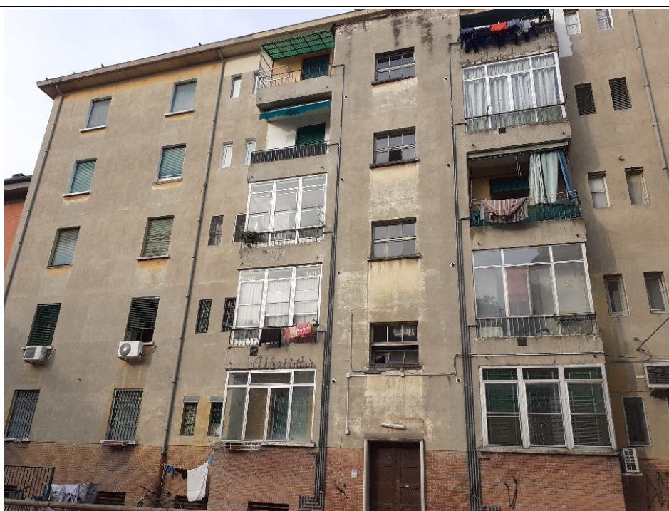
Prospetto fronte sulla corte interna