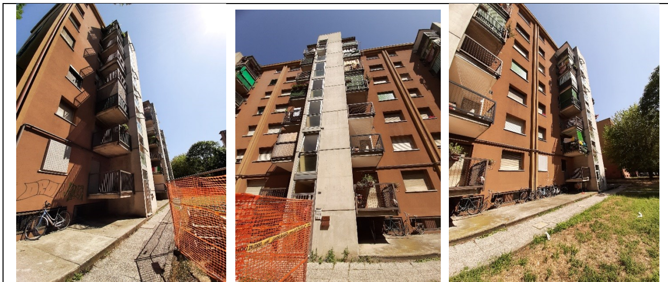
Prospetto fronte principale – entrata civ. 30-32-34