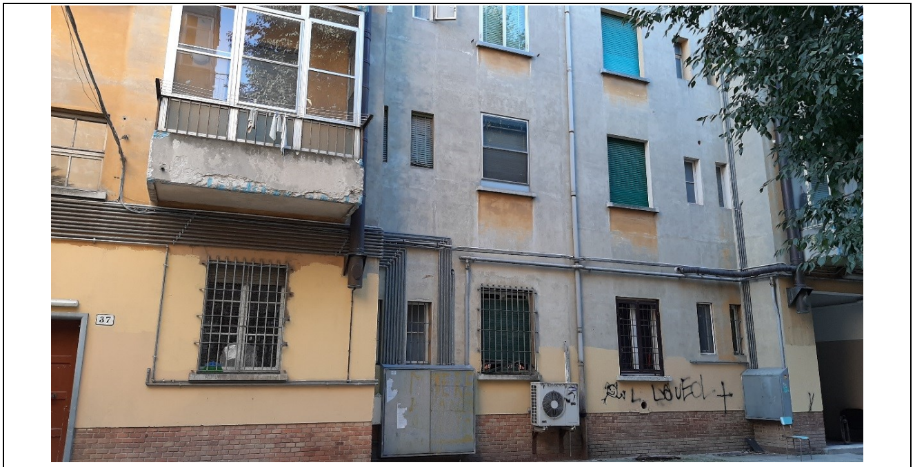
Prospetto corte interna