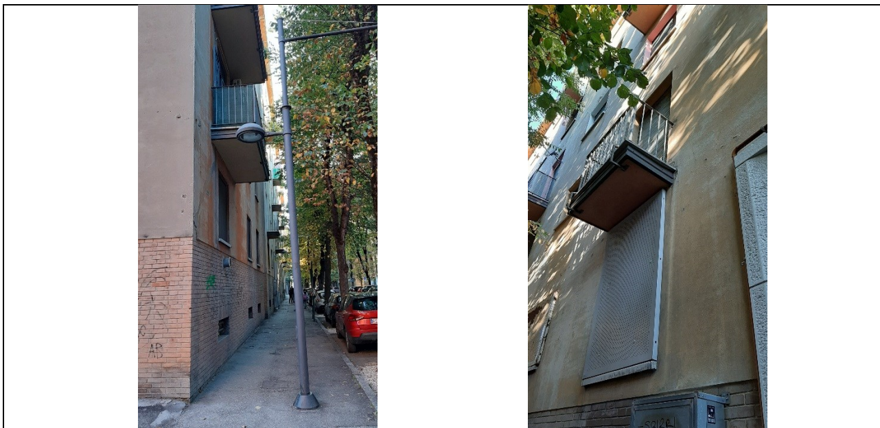
Elementi di dettaglio