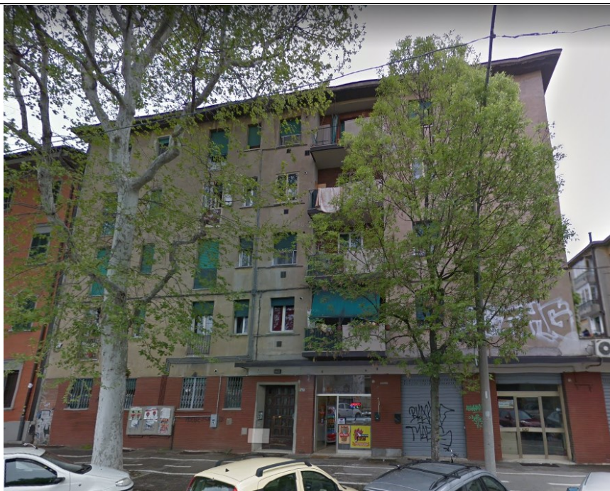
Prospetto fronte principale