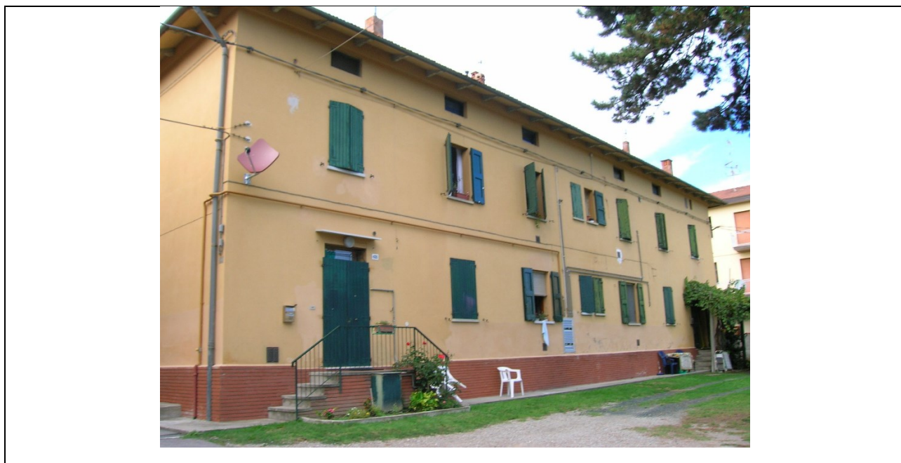
Prospetto fronte secondario