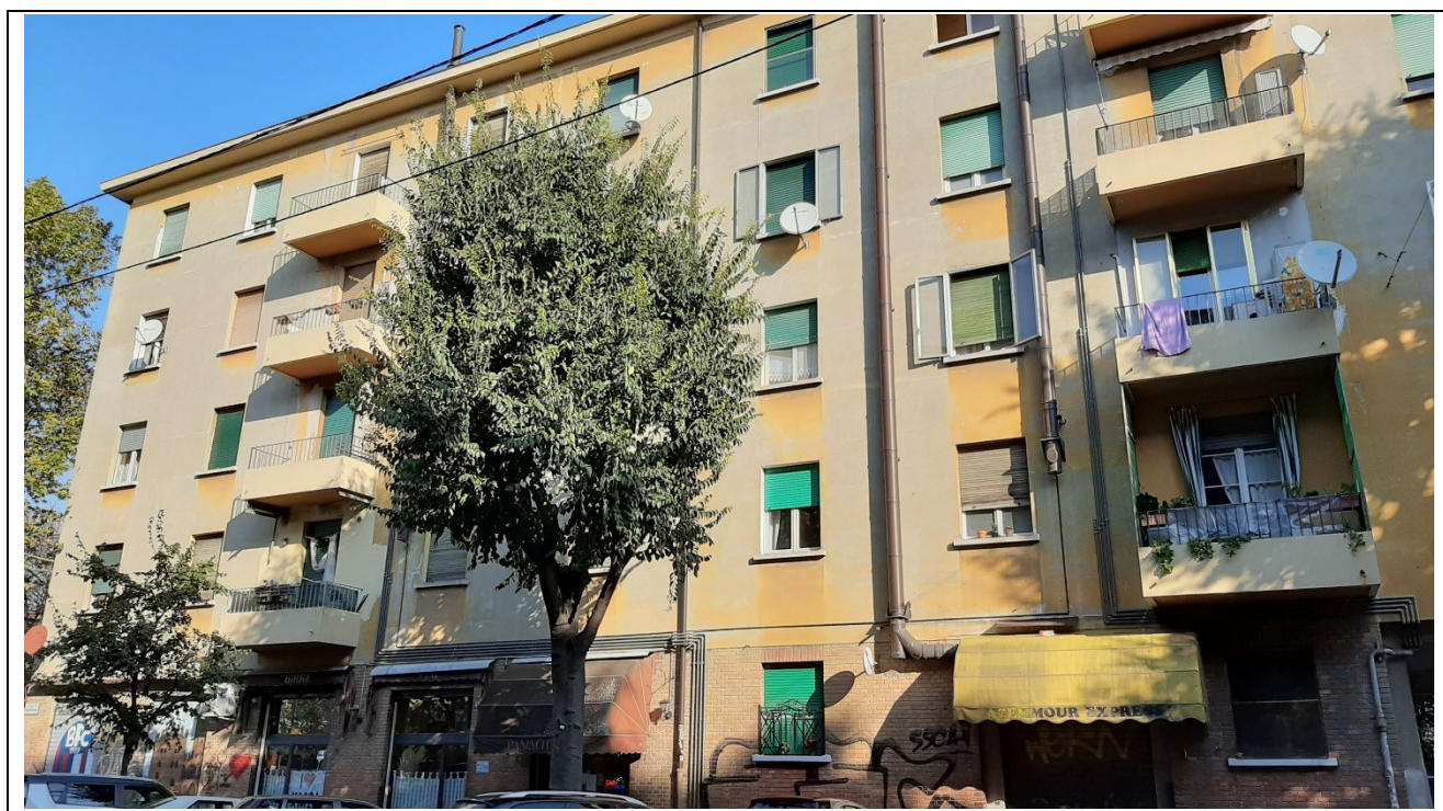
Prospetto fronte principale lato sx