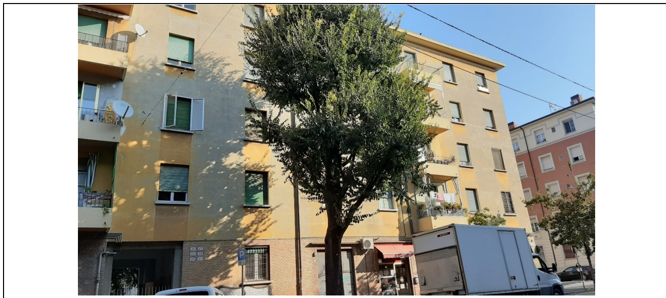
Prospetto fronte principale lato dx