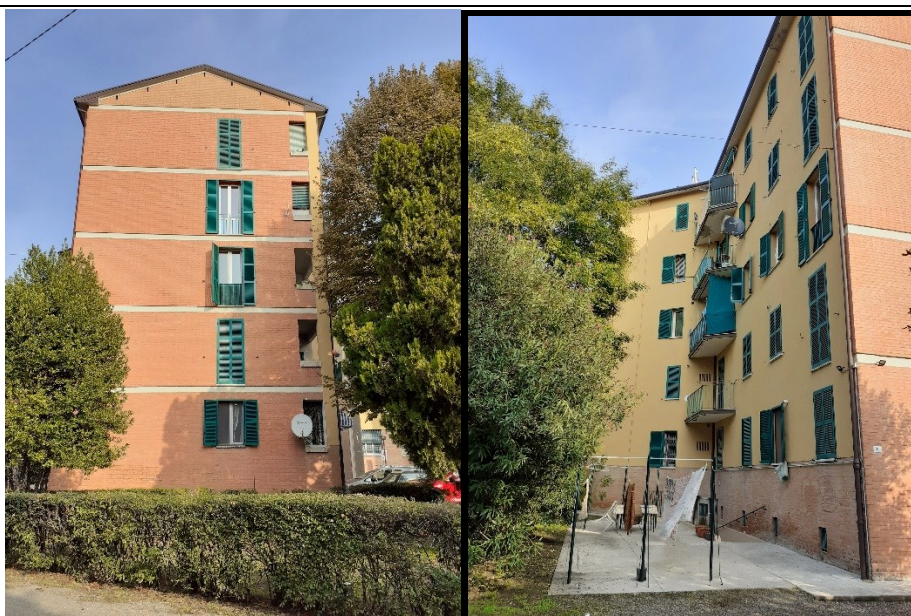
Prospetto fronte secondario