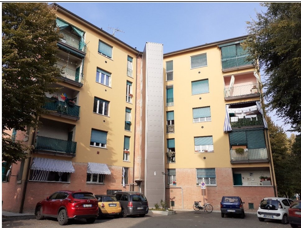
Prospetto fronte principale