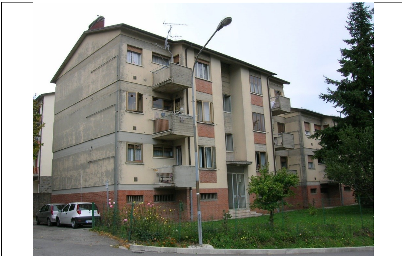
Prospetto fronte principale