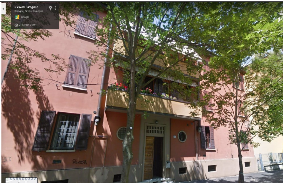
Prospetto fronte principale