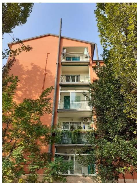
Prospetto fronte retro edificio