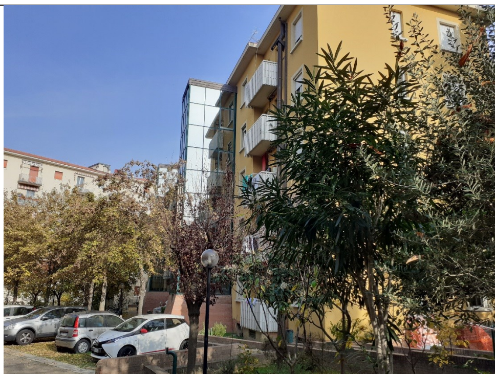
Prospetto retro edificio