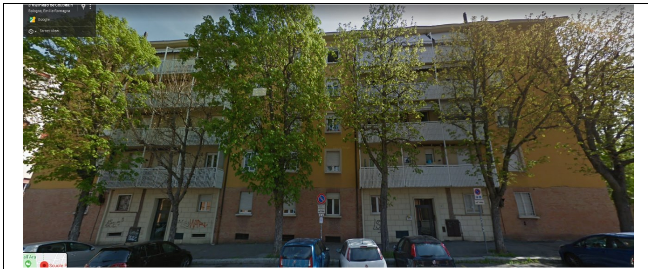
Prospetto fronte principale