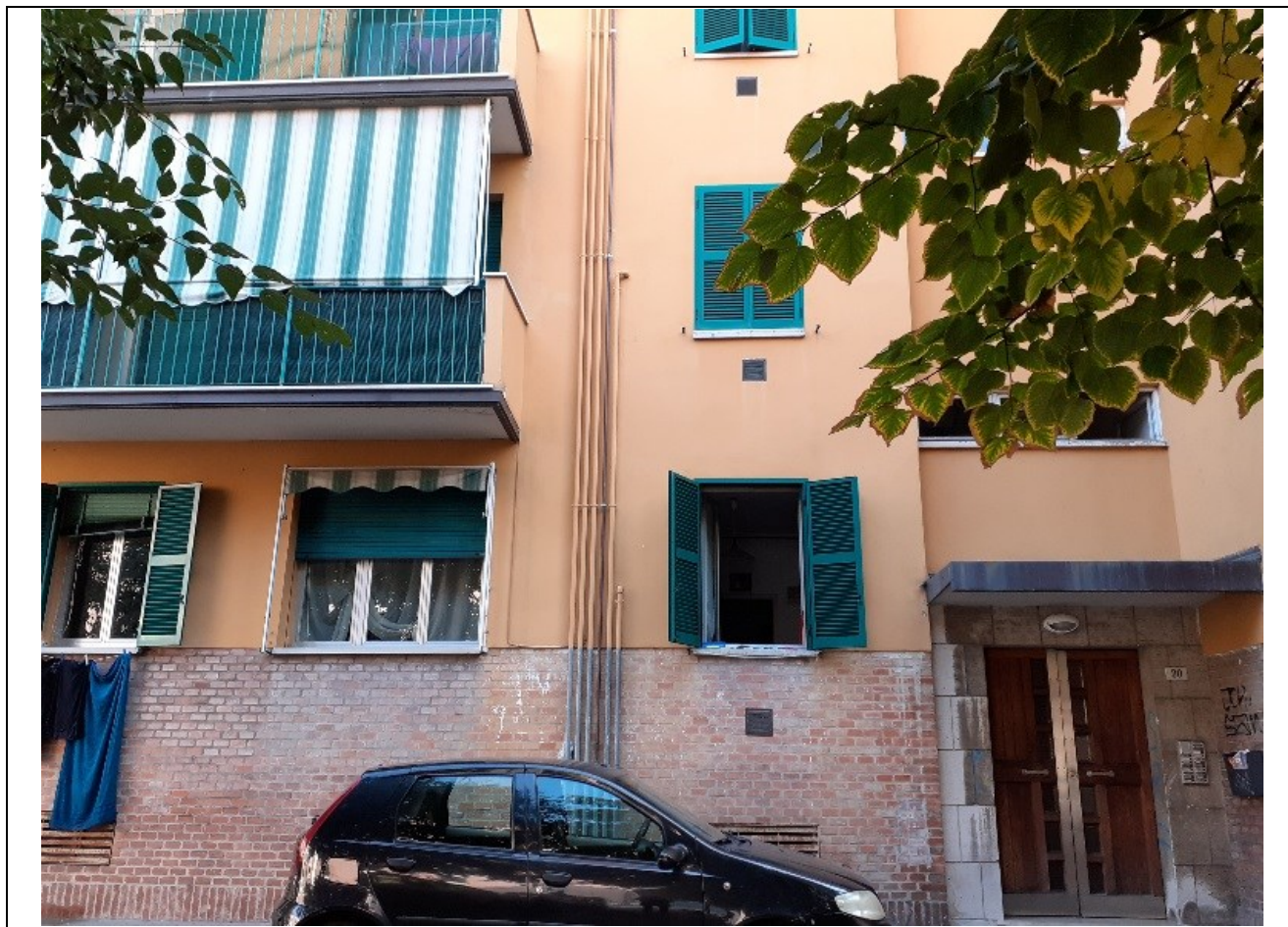
Prospetto fronte principale