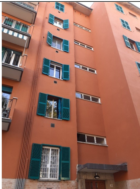
Prospetto fronte principale