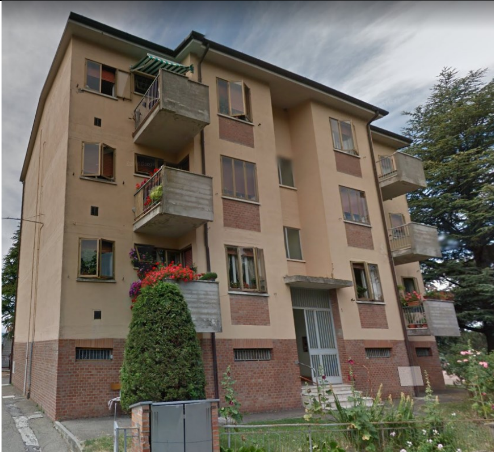
Prospetto fronte principale