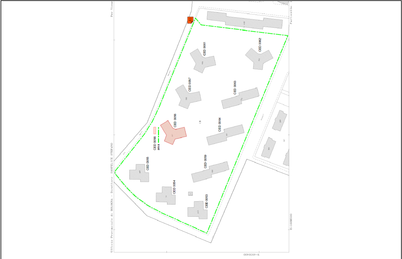
ESTRAZIONE DA COPERNICO