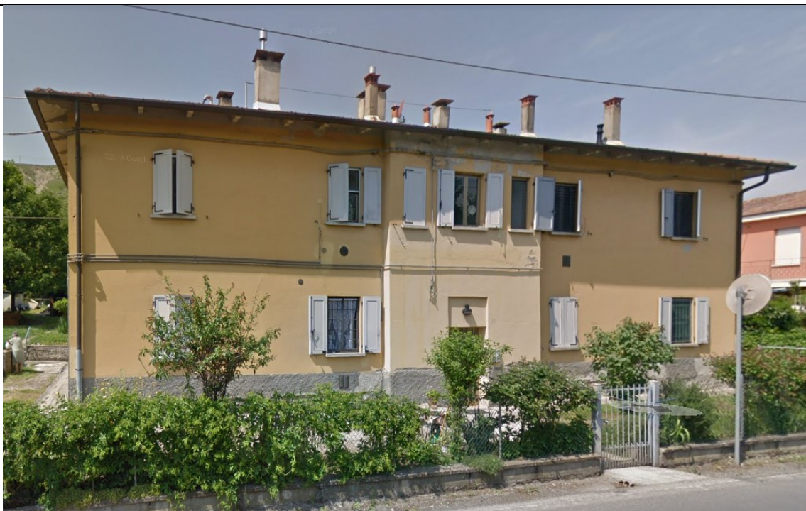
Prospetto fronte principale