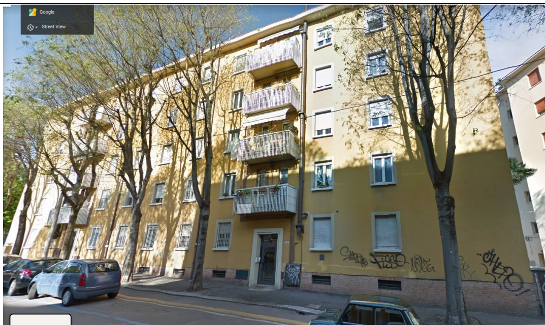
Prospetto fronte principale