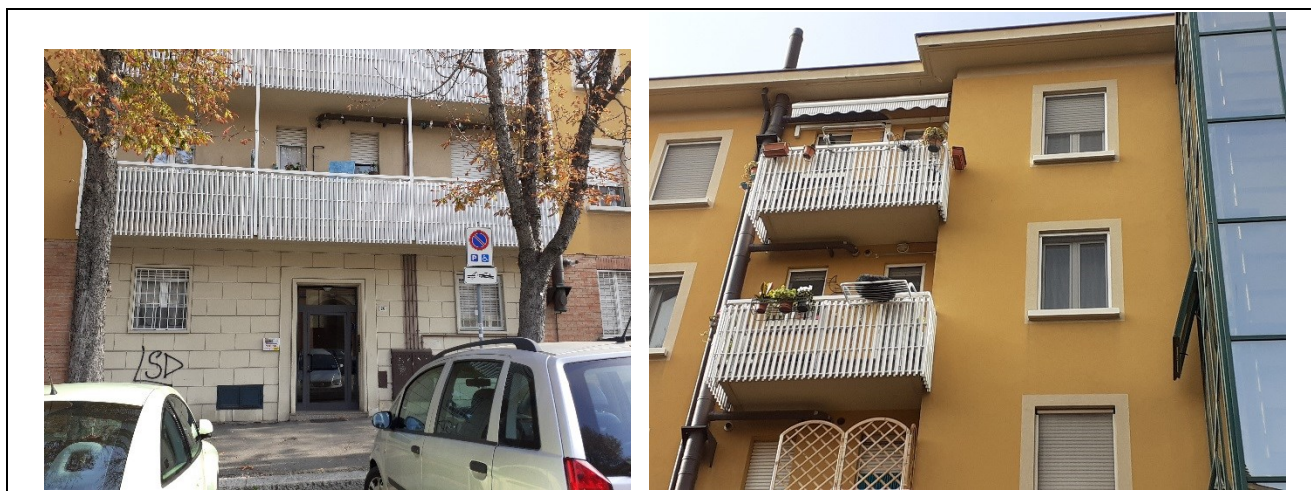
Dettagli e prospetto fronte retro edificio