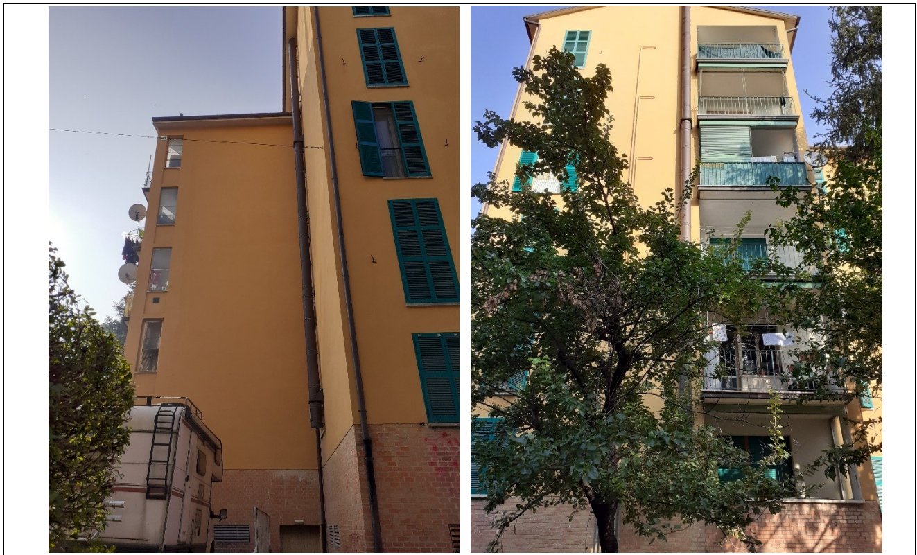
Prospetto fronte retro edificio