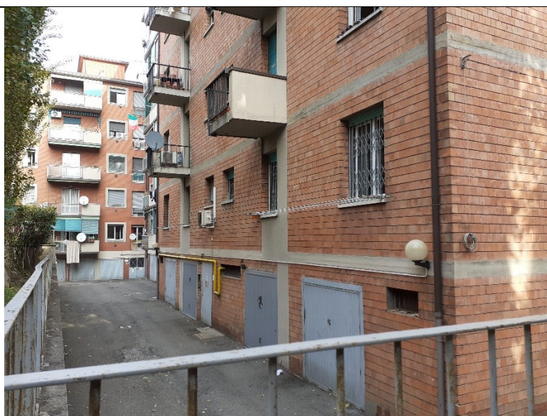
Prospetto retro edificio