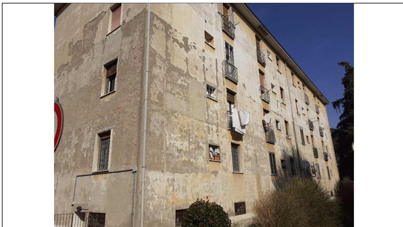
Prospetto fronte retro edificio