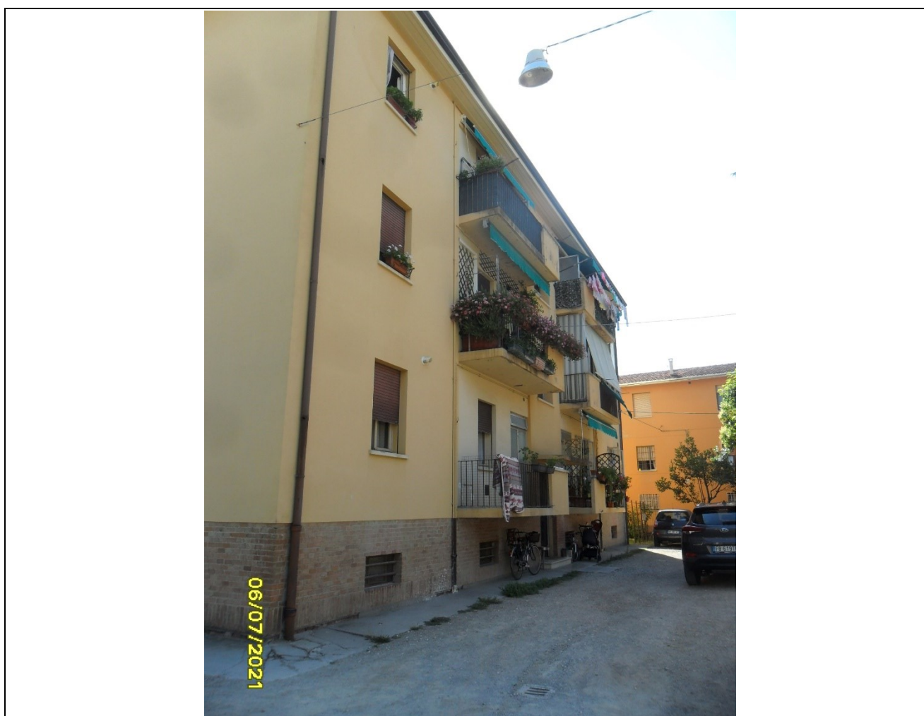
Entrata - Prospetto fronte principale