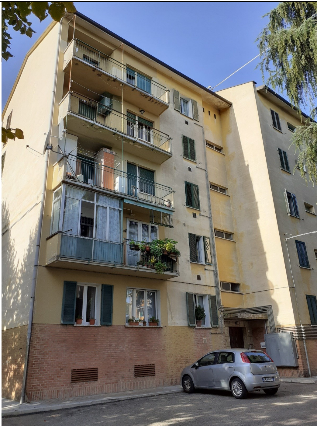
Prospetto fronte principale