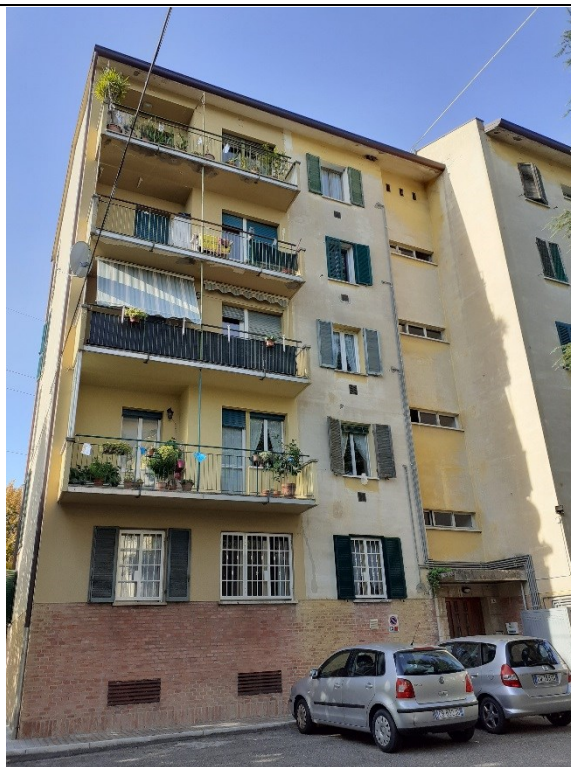
Prospetto fronte principale