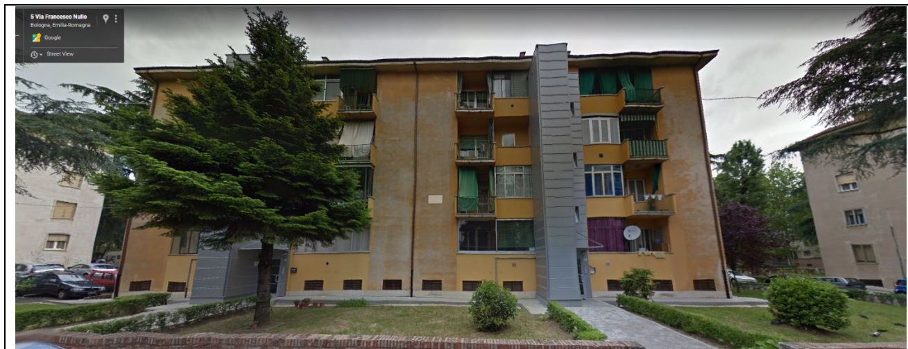
Prospetto fronte principale