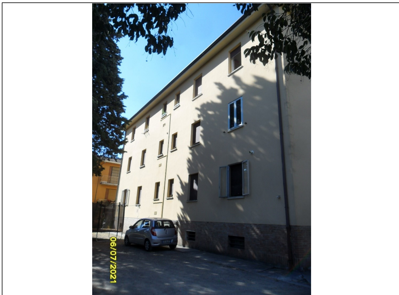
Prospetto fronte posteriore