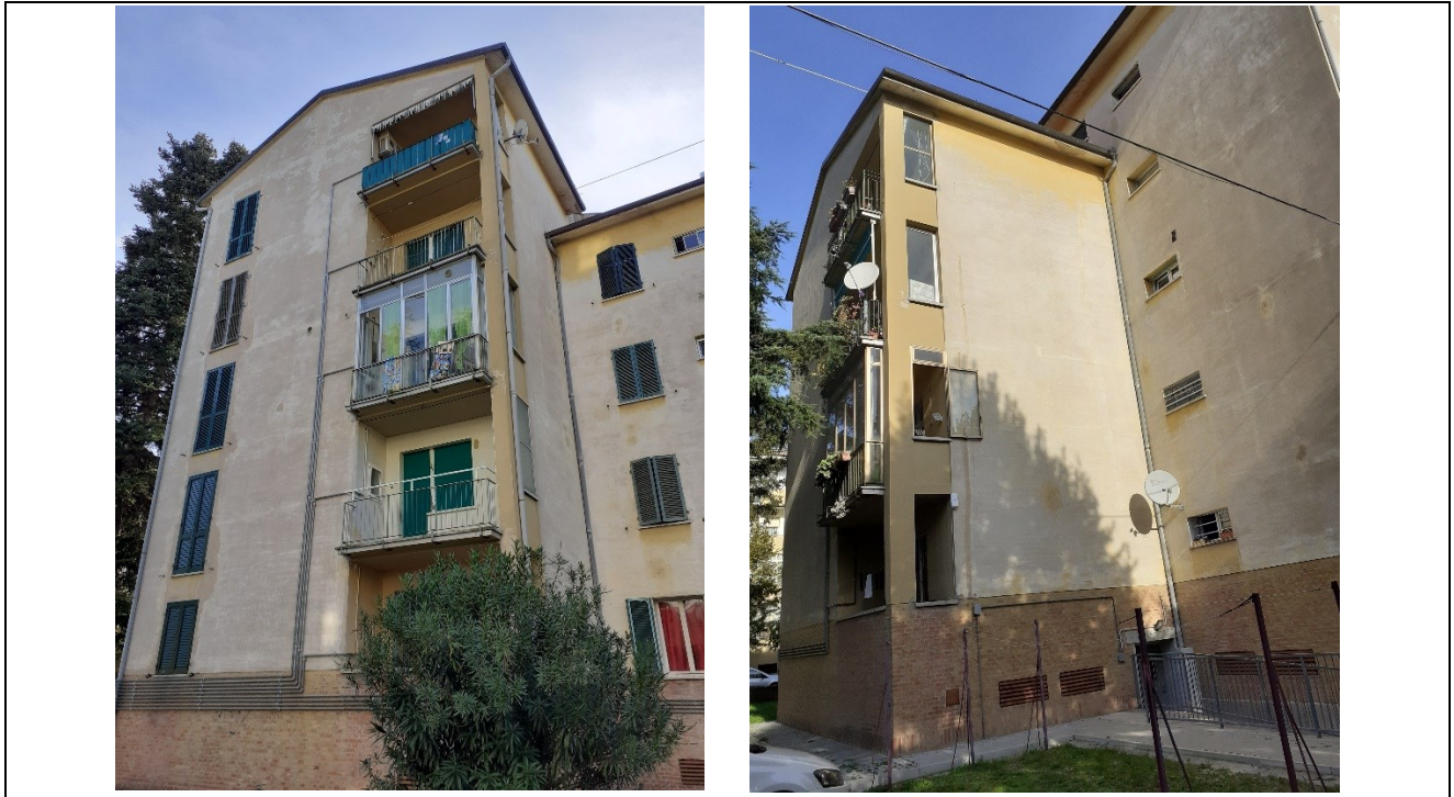
Prospetto fronte retro edificio