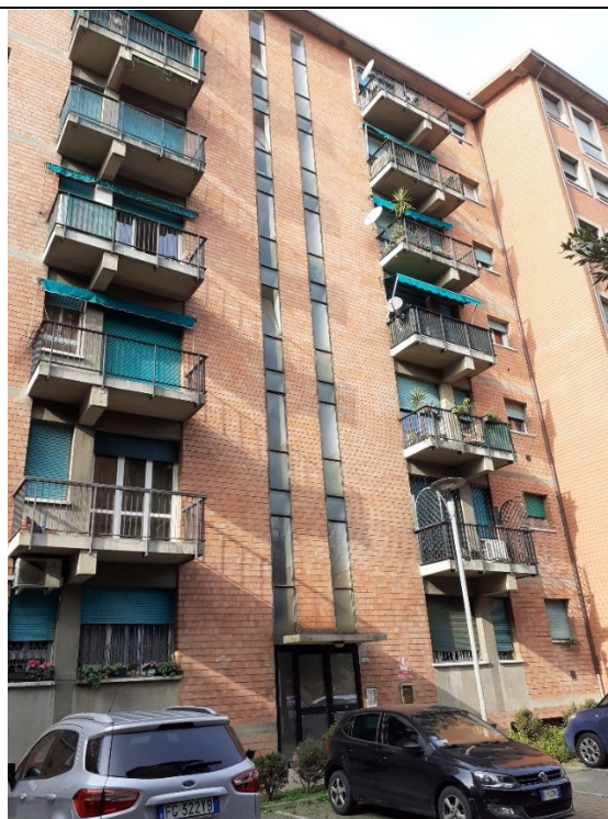
Prospetto fronte principale