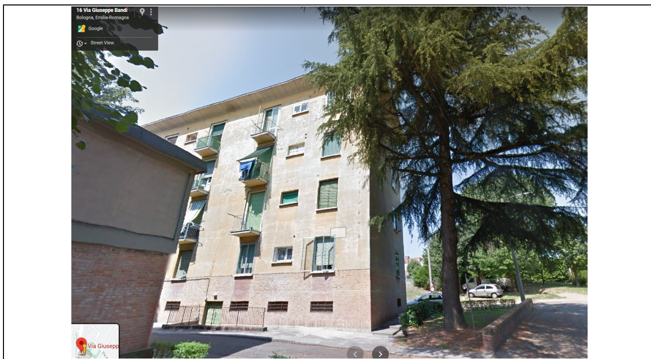
Prospetto fronte secondario