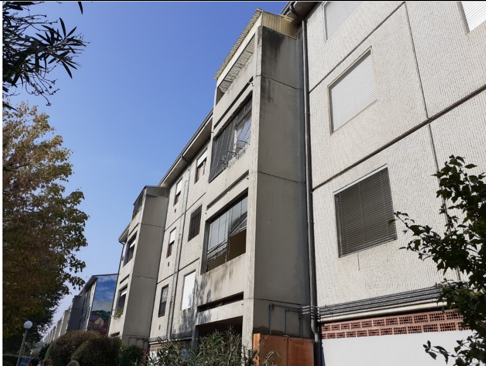
Prospetto fronte principale