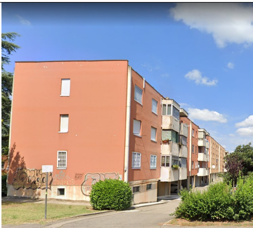
Prospetto retro edificio