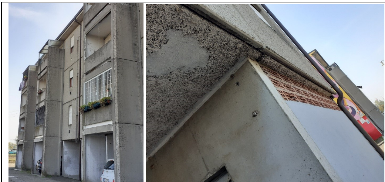
Prospetto fronte secondario