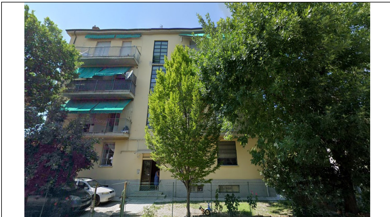
Prospetto fronte principale