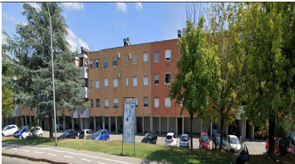
Prospetto fronte principale