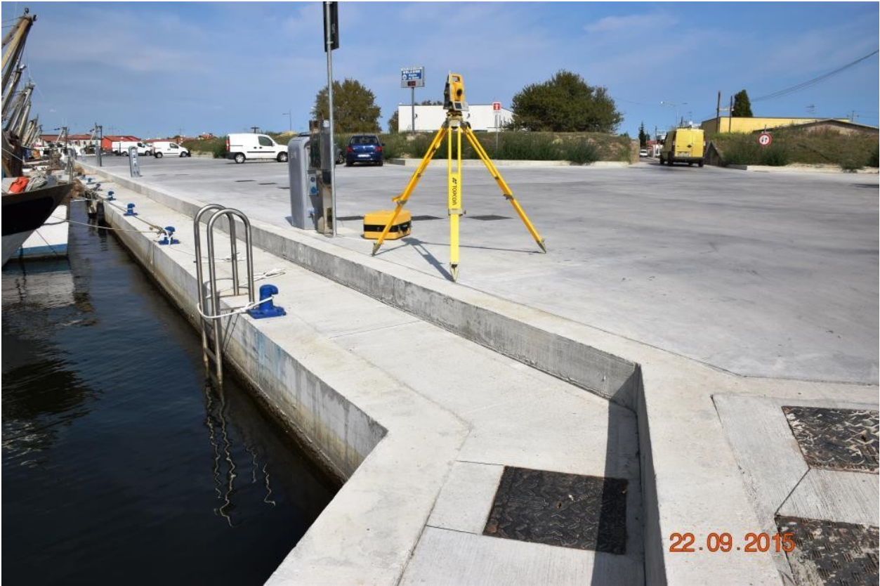
Fine area STRALCIO I