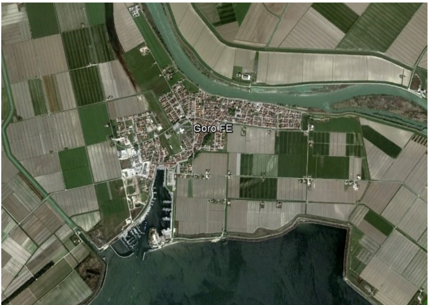
Vista aerea dell'abitato di Goro