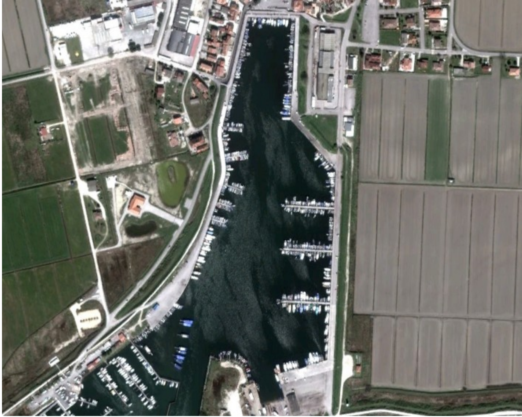
Vista aerea del porto