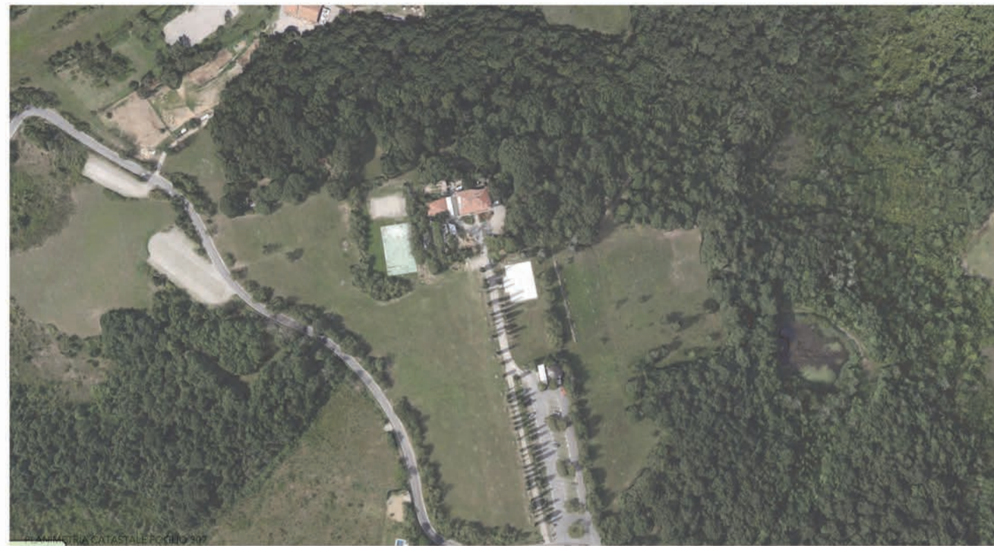
PLANIMETRIA STATO DI FATTO