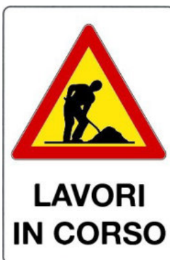
Lavori in corso