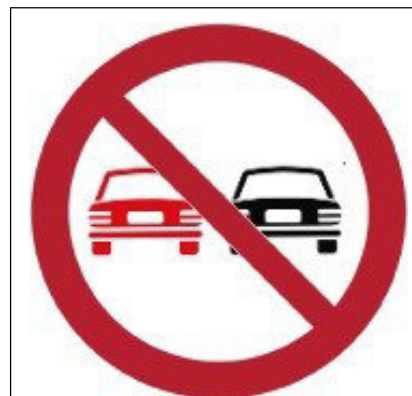
Divieto di sorpasso