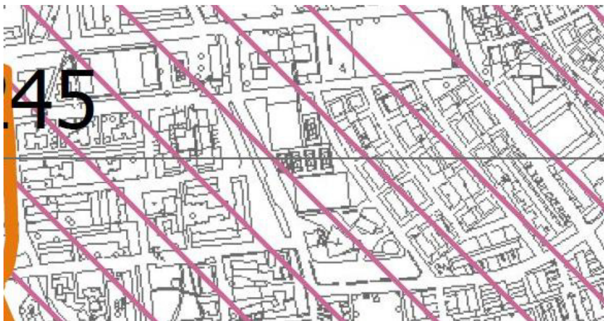
PARTICOLARI TUTELE zone di tutela dei corpi idrici superficiali e sotterranei (artt. 34-35 PTCP) (art.5.20)

Da ciò si evince che l'area è sottoposta a Particolari tutele: zona di tutela dei corpi idrici superficiali e sotterranei (art. 34-35 PTCP) (art.5.20 PSC).