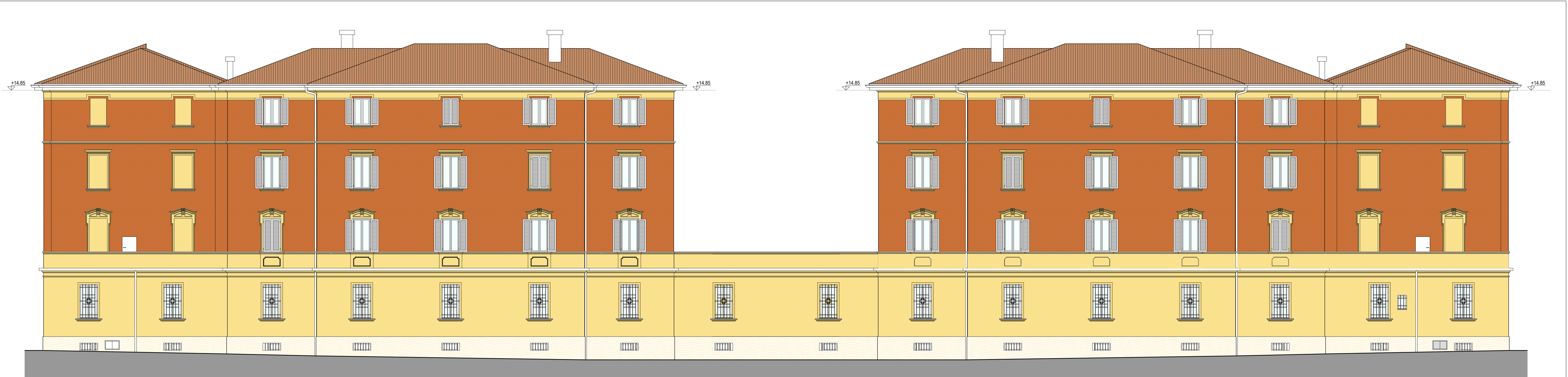
PROSPETTO SU VIA MUSOLESI