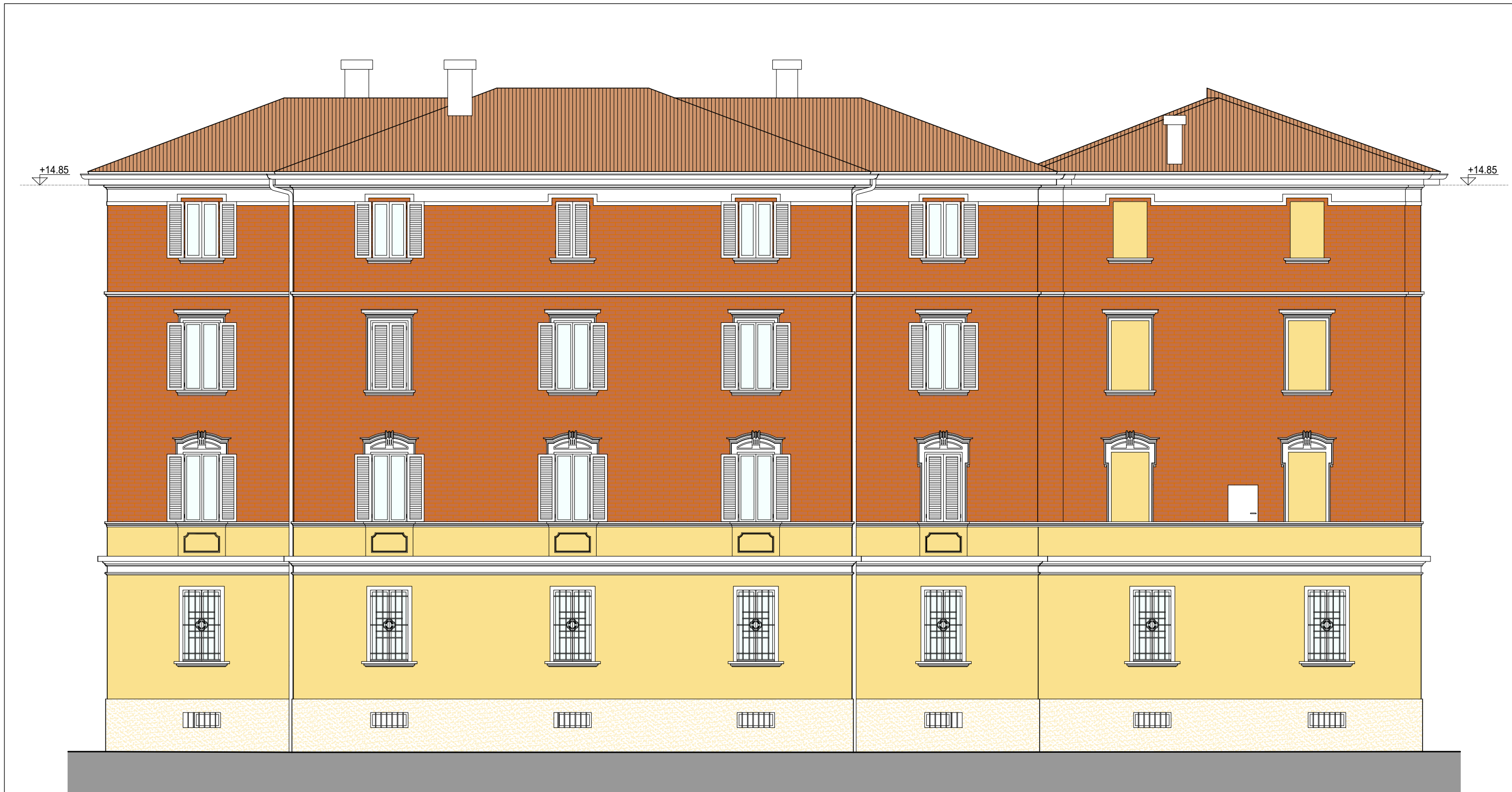
PROSPETTO SU VIA SCIPIONE DAL FERRO LATO NORD