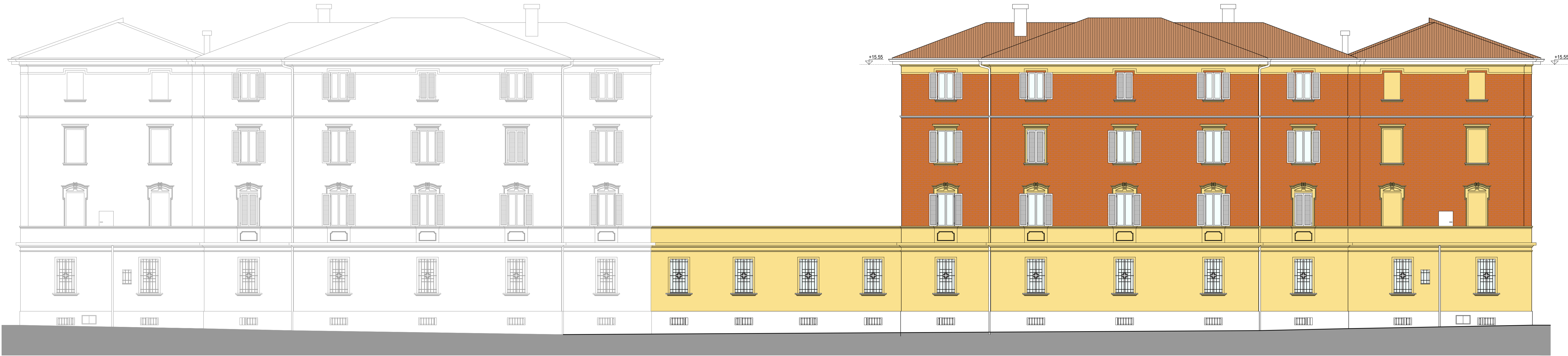
PROSPETTO SU VIA PALMIERI