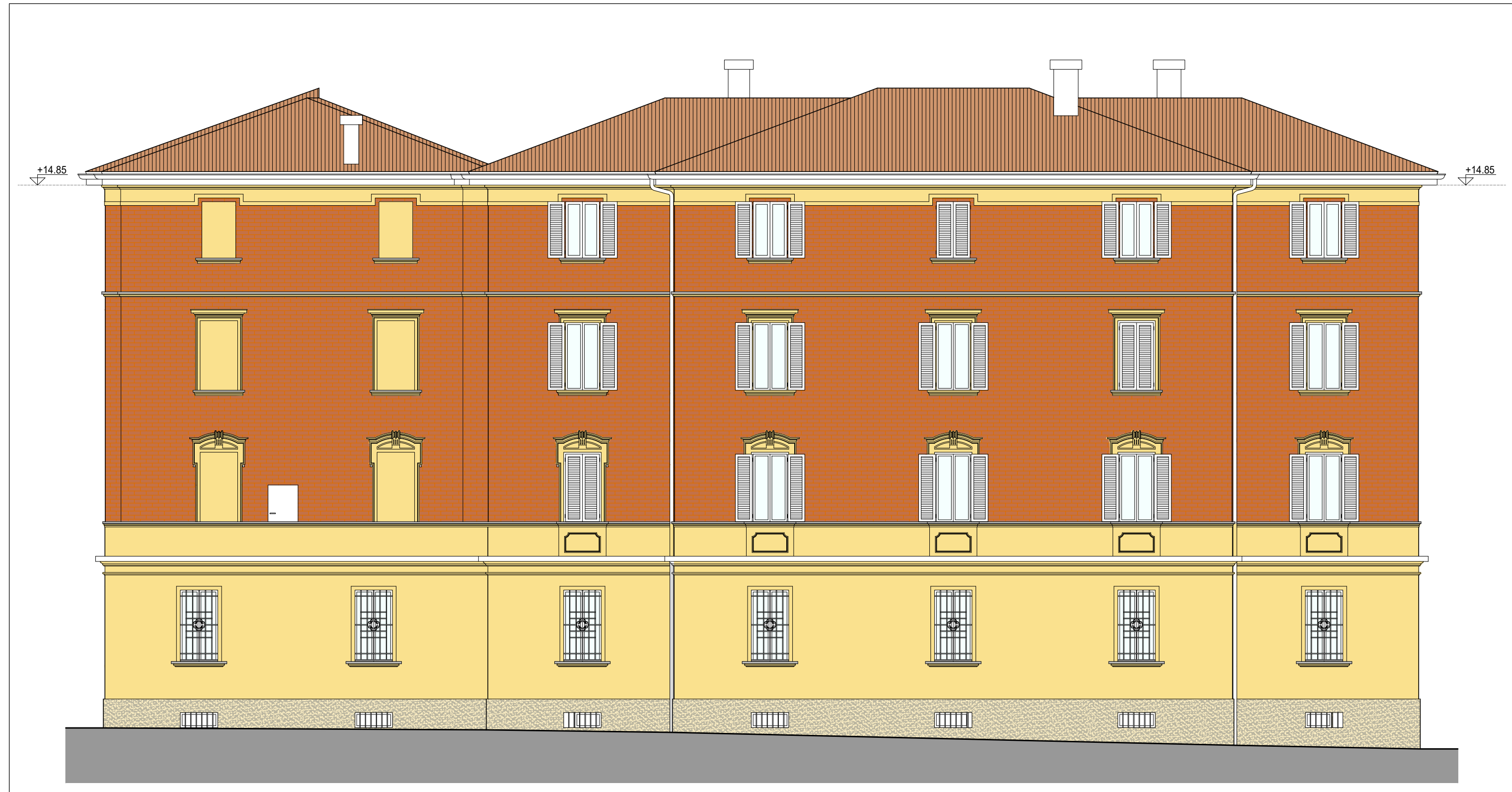
PROSPETTO SU VIA LIBIA