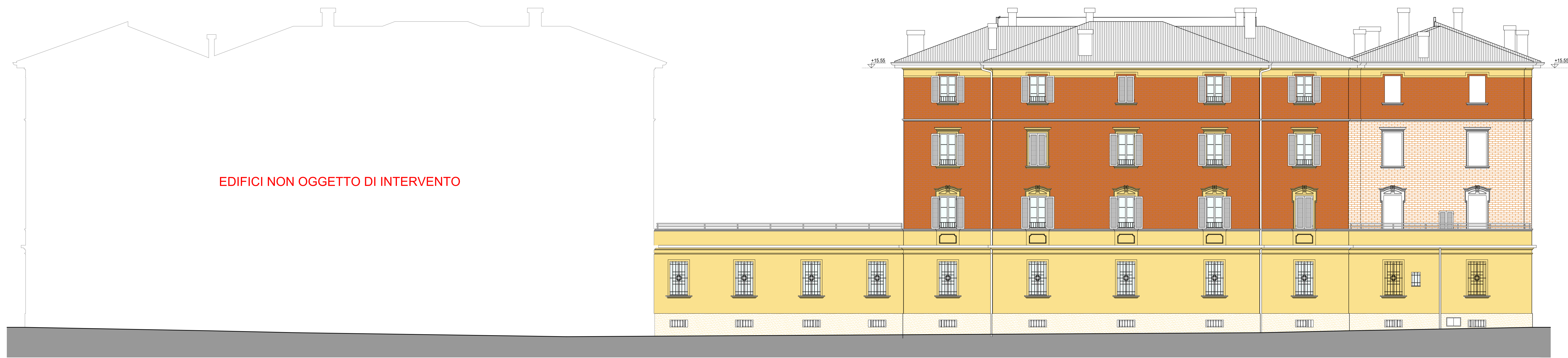
PROSPETTO SU VIA PALMIERI