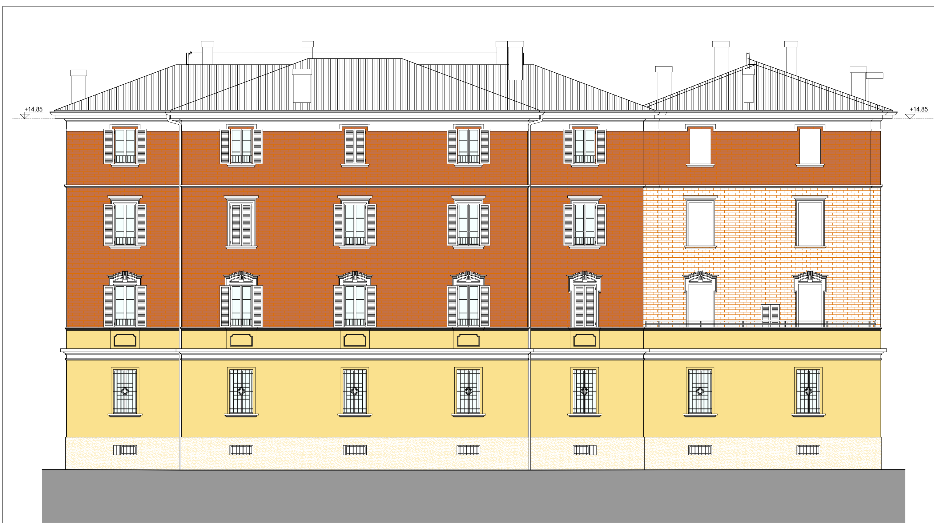
PROSPETTO SU VIA SCIPIONE DAL FERRO LATO NORD