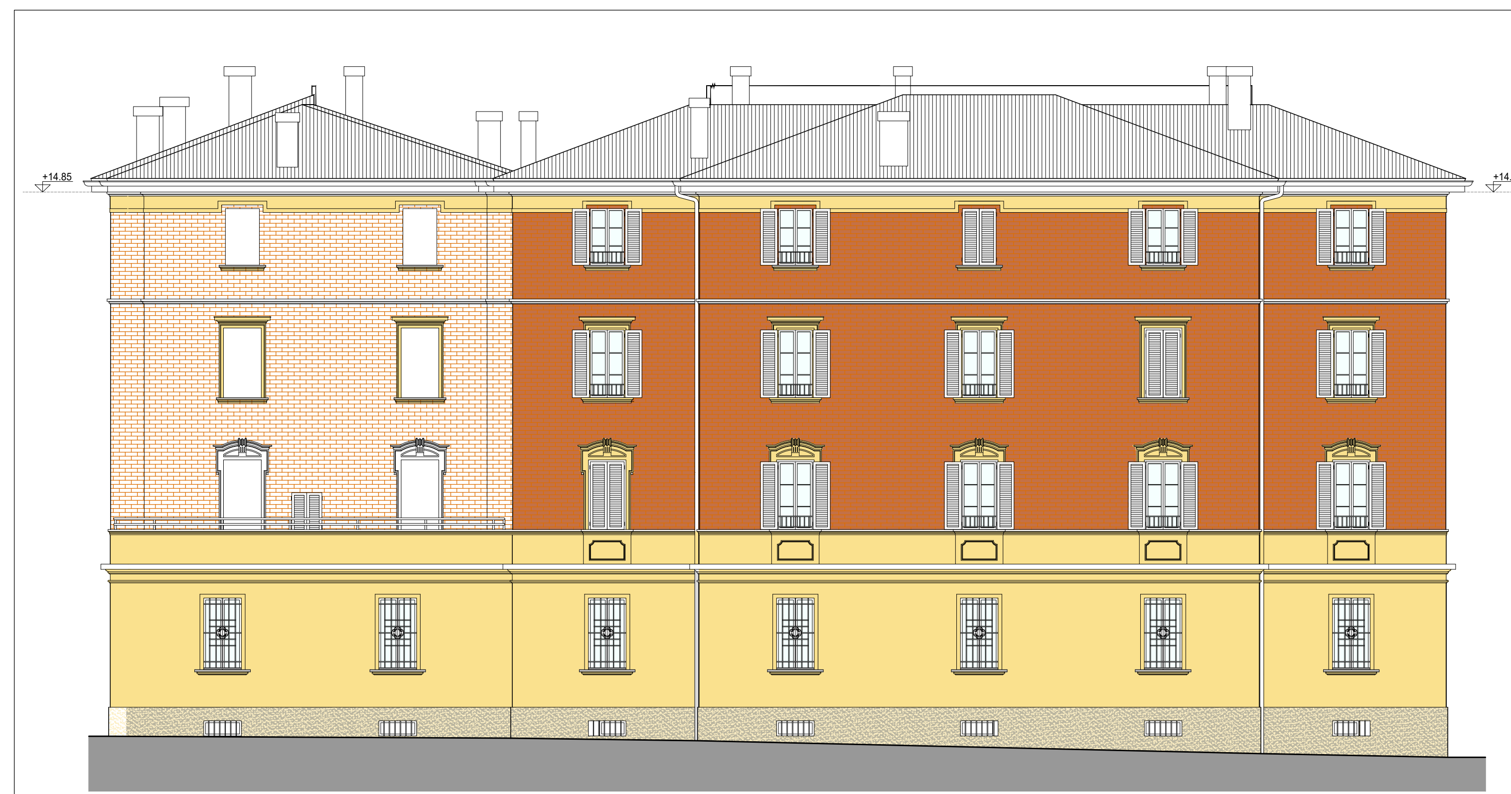
PROSPETTO SU VIA LIBIA