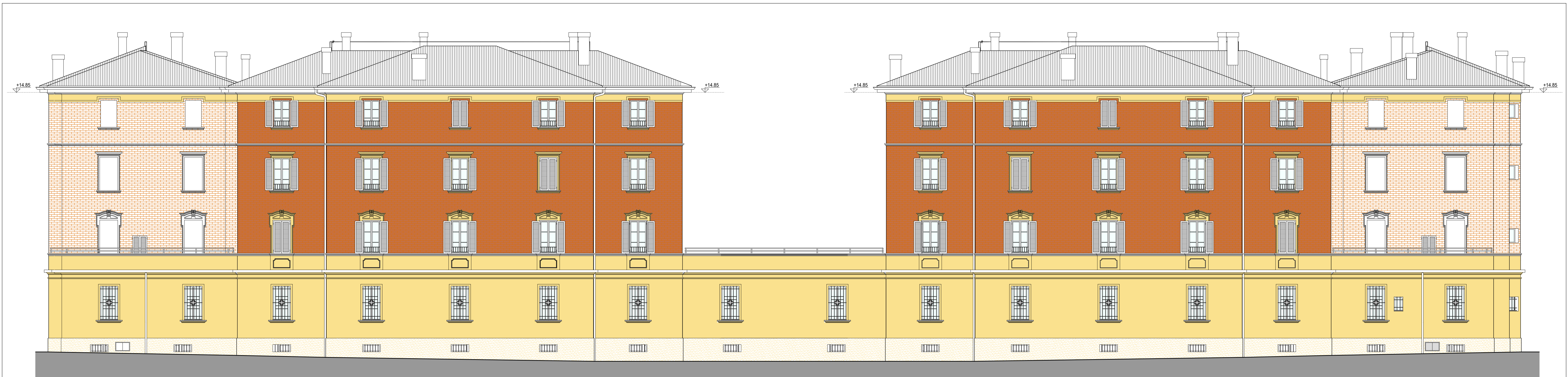
PROSPETTO SU VIA MUSOLESI