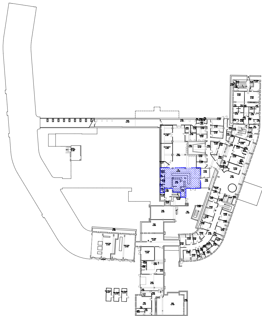
Inquadramento - Scala 1: 1.000