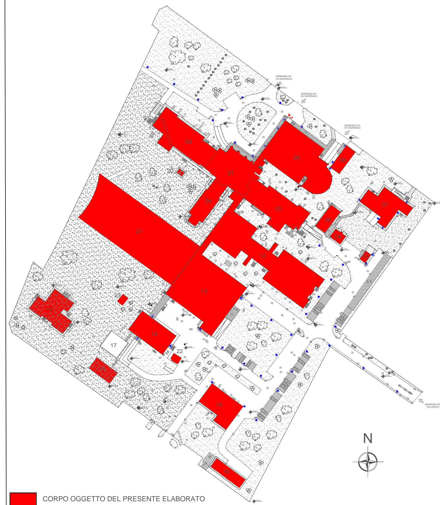
CORPO OGGETTO DEL PRESENTE ELABORATO