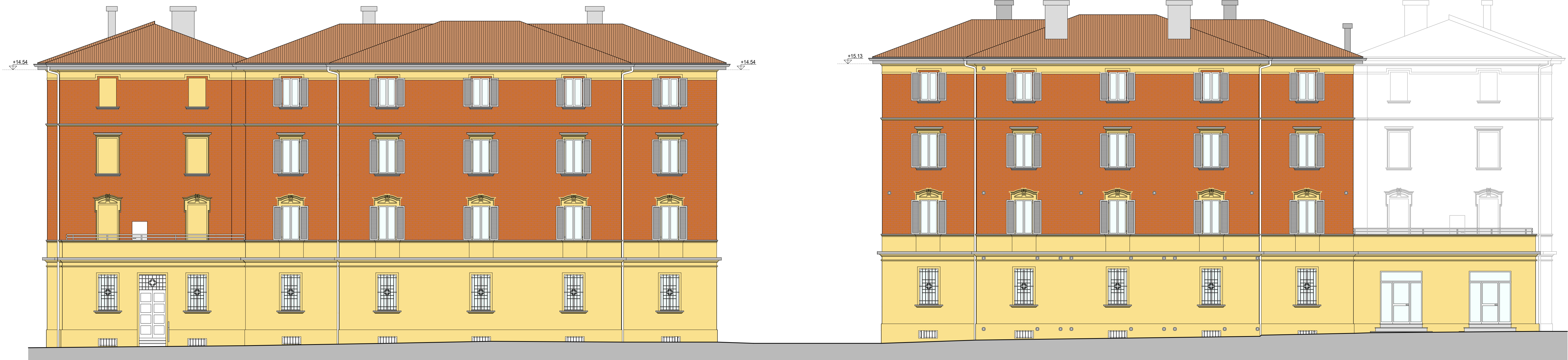
PROSPETTO SU VIA BENTIVOGLI