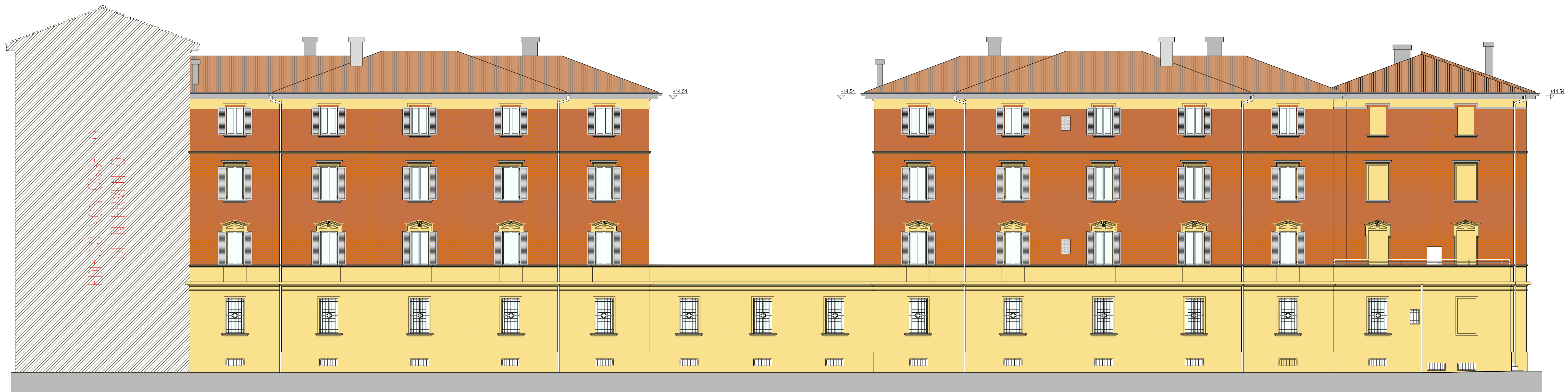
PROSPETTO SU VIA MUSOLESI

SI RIMANDA ALL'IMPRESA ESECUTRICE, PRIMA DELL'INIZIO DEI LAVORI, LA VERIFICA DELLE QUOTE E DELLE EFFETTIVE DIMENSIONI RELATIVE ALLE STRUTTURE OGGETTO DI INTERVENTO