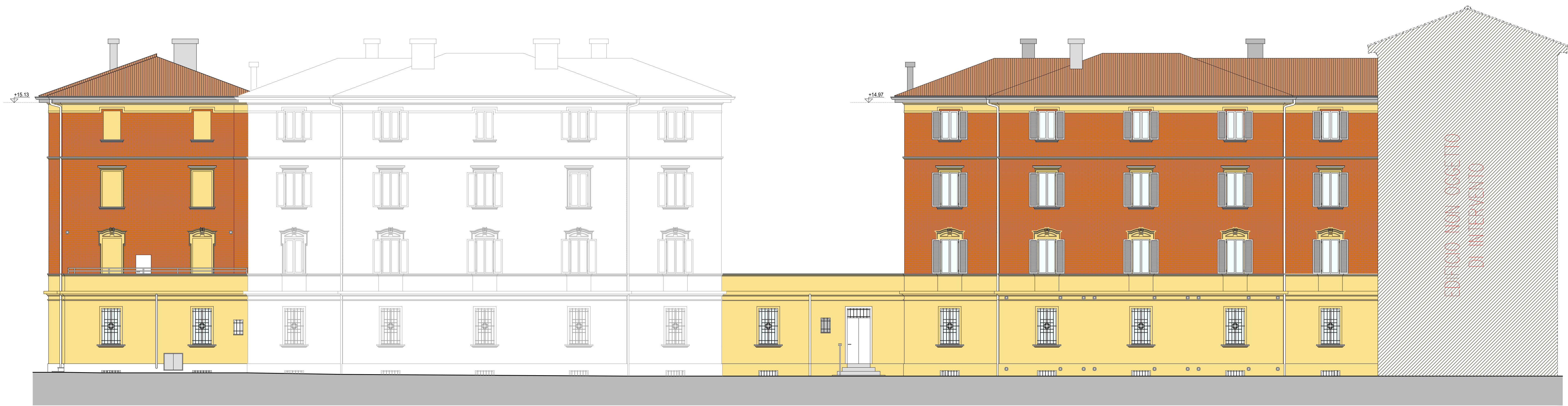
PROSPETTO SU VIA PALMIERI