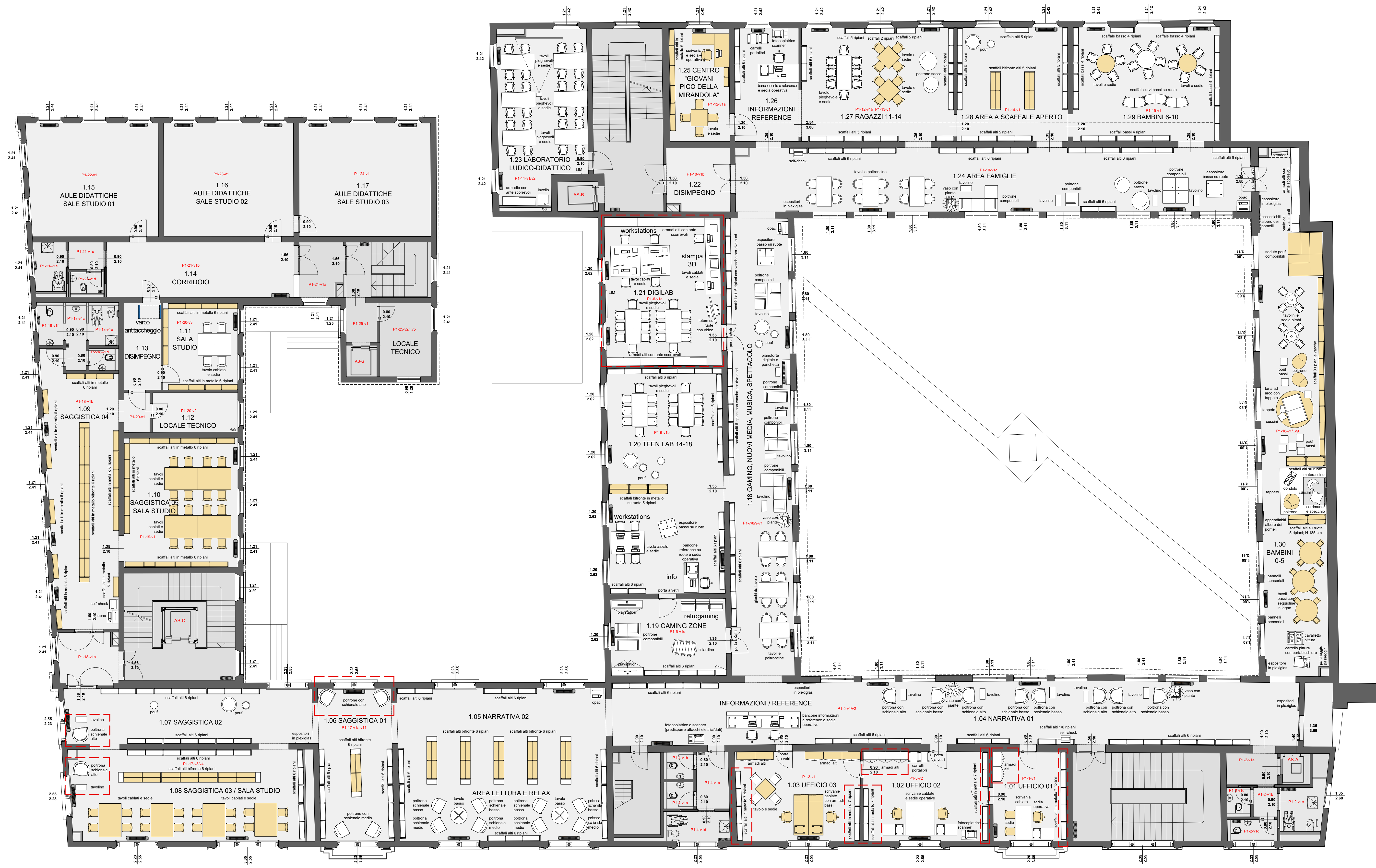
PIANTA ARREDATA PIANO PRIMO scala 1:100