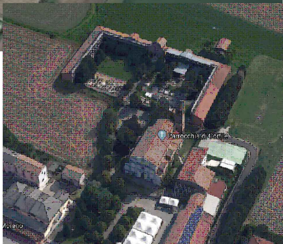
CIMITERO FRAZIONALE DI CORTILE VISTA AEREA