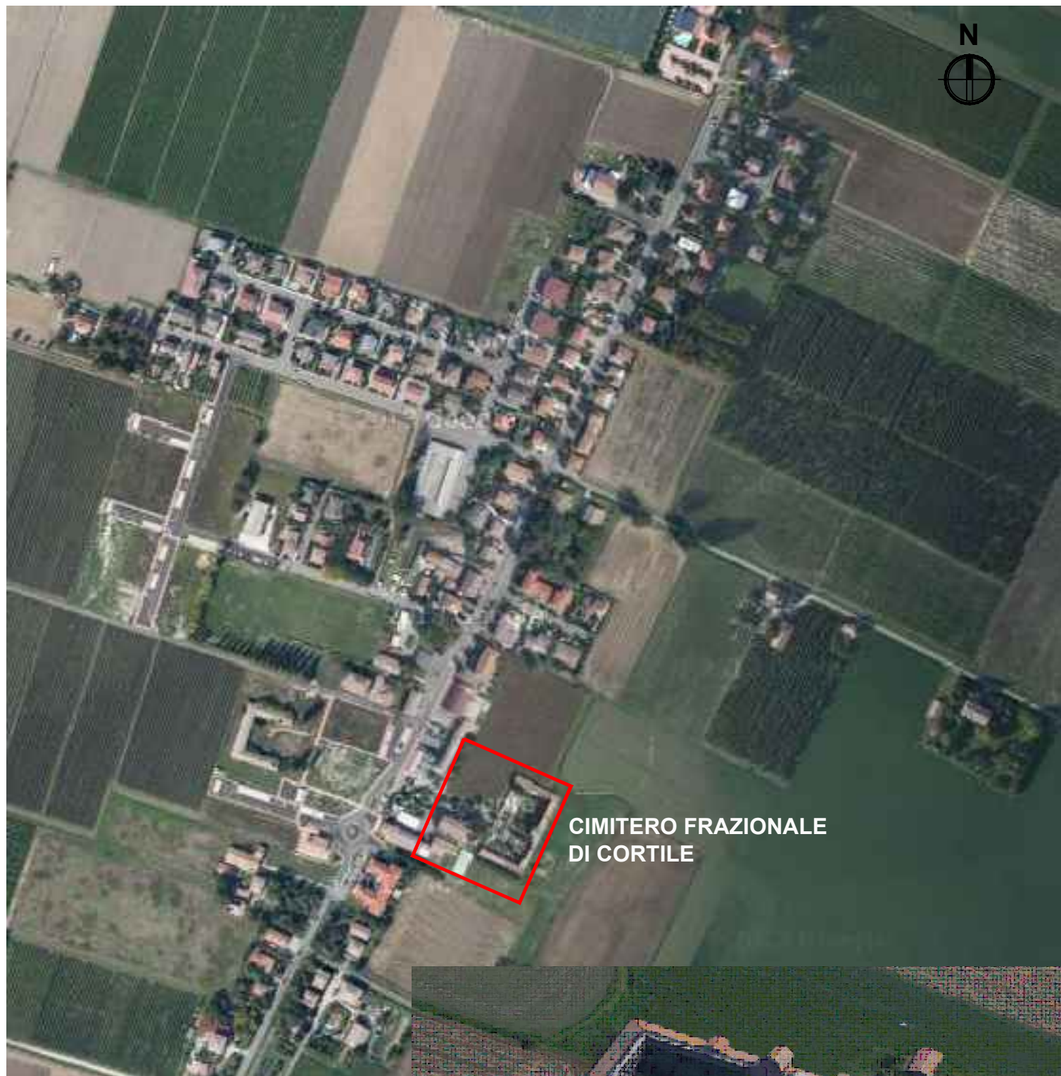
CIMITERO FRAZIONALE DI CORTILE