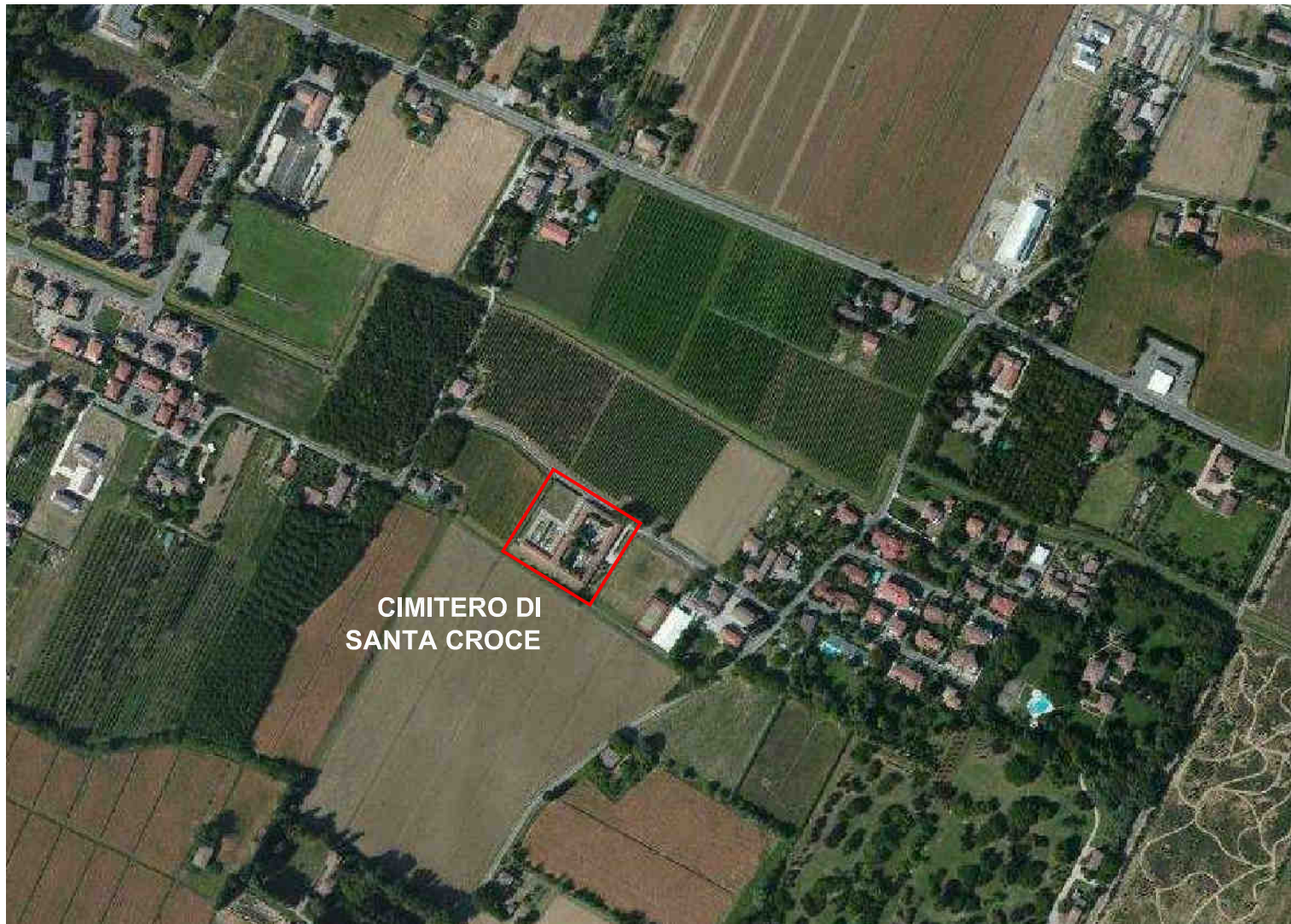
CIMITERO DI SANTA CROCE